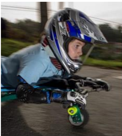
Fig.3 – Dettaglio delle protezioni: casco, paracollo e guanti

La scelta del casco deve garantire la protezione completa del mento in ogni situazione di gara (Fig.3).