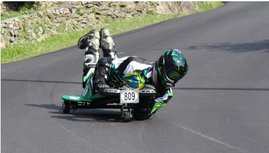
Fig.2 – Posizione di guida e protezioni del corpo

Il casco deve essere omologato, di tipo integrale o tipo motocross con gli occhiali.