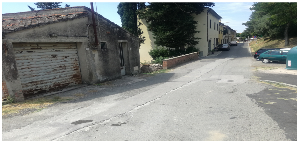
il tratto dove sarà ubicato il traguardo